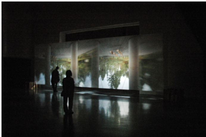
カメラ・オブスクラ@金津創作の森美術館 / ©佐藤時啓

ラテン語で「暗い部屋」を意味する「カメラ・オブスクラ」は、真っ暗な部屋の壁に孔が穿たれると、漏れ入る光によって外の景色が反対側の壁に自然に像を結ぶ現象です。17世紀になると画家の描画補助具としても用いられ、現在使われている「カメラ」という言葉の語源になりました。今回は土門拳記念館の屋内に逆さまの拳湖や周辺の景色を映し出します。鳥海山も見えるかもしれません。