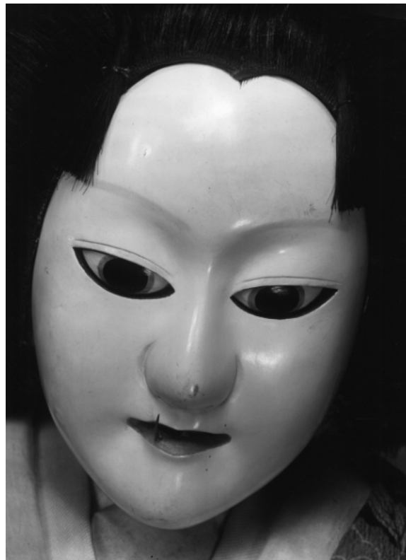
《「恋女房染分手綱」重の井（かしらは老女形）》1941年

写真家・土門拳（1909-1990年）が撮影した多様な“眼”に焦点をあてる展覧会を開催いたします。 20世紀日本のドキュメンタリー写真を代表する『ヒロシマ』（1958年）や『筑豊のこどもたち』（1960年）には、被写体となった人々の眼が印象的な作品が数多く含まれています。何かを強く求め訴えかけてくるような眼があれば、時には現代の私たちの在り方を問うような深く静かな瞳もあります。昭和の著名人たちの肖像を収めた『風貌』（1953年）シリーズでは、激動の時代を切り拓いていった者たちの才気あふれる眼差しに、時を超えて対面することができます。『文楽』（1972年）や『古寺巡礼』（1963~1975年）といった写真集では、日本美術史の中で生み出され、継承されてきた個性的な眼の造形の数々が、土門特有のクローズアップ撮影によって鮮やかに切り撮られてきました。