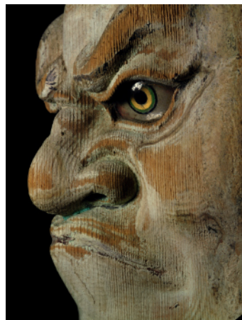
《室生寺金堂丑神（十二神将のうち）面相左》 1965～1966年頃