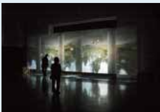
カメラ・オブスクラ @金津創作の森 美術館 ©佐藤時啓

ラテン語で「暗い部屋」を意味する「カメラ・オブスクラ」は、真っ暗な部屋の壁に孔が穿たれると、漏れ入る光によって外の景色が反対側の壁に自然に像を結ぶ現象です。17世紀になると画家の描画補助具としても用いられ、現在使われている「カメラ」という言葉の語源になりました。今回は土門拳記念館の屋内に逆さまの拳湖や周辺の景色を映し出します。鳥海山も見えるかもしれません。